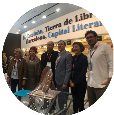
Entrega premi categoria Plata del XXIV Premi al millor estand

Entre els participants d'aquestes activitats es va comptar amb la presència d'Enrique Krauze, Irvine Welsh, Héctor Aguilar Camín i José Woldenberg, qui a més va organitzar el fòrum Pensar México, amb prop de 11.500 visitants. Aquestes accions, sumades a les campanyes per impulsar l'ús de mitjans alternatius de transport, busquen contribuir a fer de la FIL una activitat més responsable amb el medi ambient.