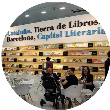
Estand Catalan Arts al FIL Guadalajara