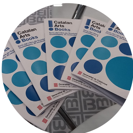
Librets Catalan Arts Books