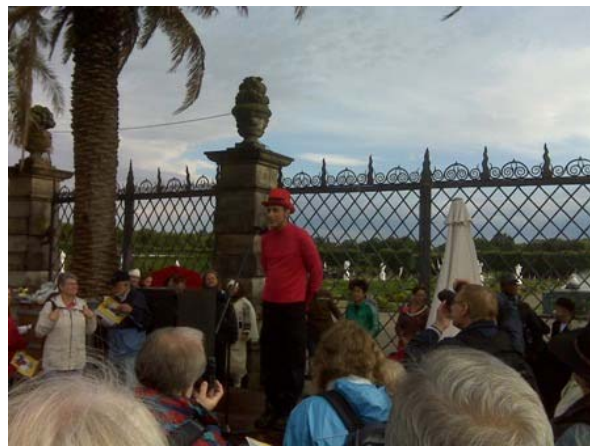
La cia. catalana Trukitrek durant el discurs de benvinguda