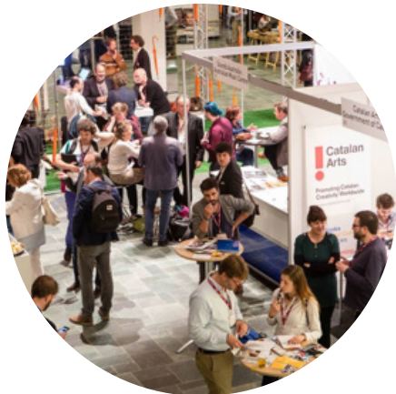
Recinte firal a De Doelen