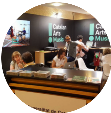
Estand de Catalan Arts al Midem

El Midem by Night concentrava tots els concerts, tant la part de programació oficial com de l'Off. A la programació oficial hi va haver 4 vetllades amb 26 formacions vingudes del Regne Unit, Bèlgica, Taiwan, Xile, entre altres. Els tres caps de cartell foren M.ANIFEST, Wycleff Jean, i Acid Arab.