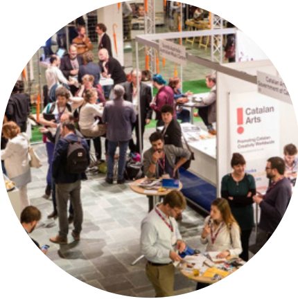
Recinte firal a De Doelen