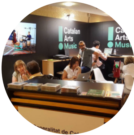
Estand de Catalan Arts al Midem

El Midem by Night concentrava tots els concerts, tant la part de programació oficial com de l'Off. A la programació oficial hi va haver 4 vetllades amb 26 formacions vingudes del Regne Unit, Bèlgica, Taiwan, Xile, entre altres. Els tres caps de cartell foren M.ANIFEST, Wycleff Jean, i Acid Arab.