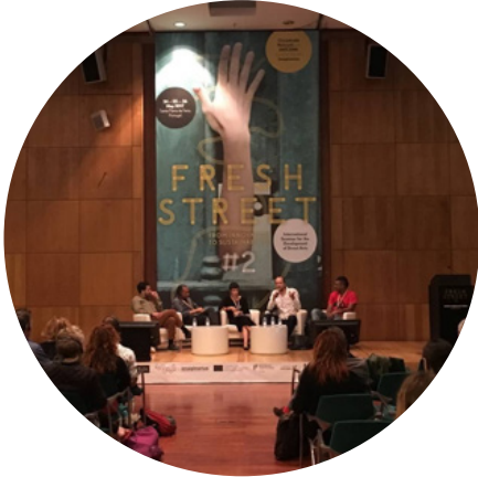
Fresh Street International Seminar